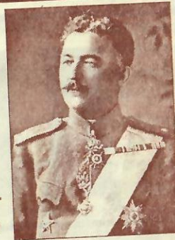
ген. Александър Протогеров

Три села носят неговото име - Дрангово-Карджалийското, Дрангово-Петричко и Дрангово-Пловдивско; две песни са посветени на Дрангов: „Народна песен за полк. Дрангов“ и „Гордей се майко Македонийо“; десетки улици в най-различни градове носят неговото